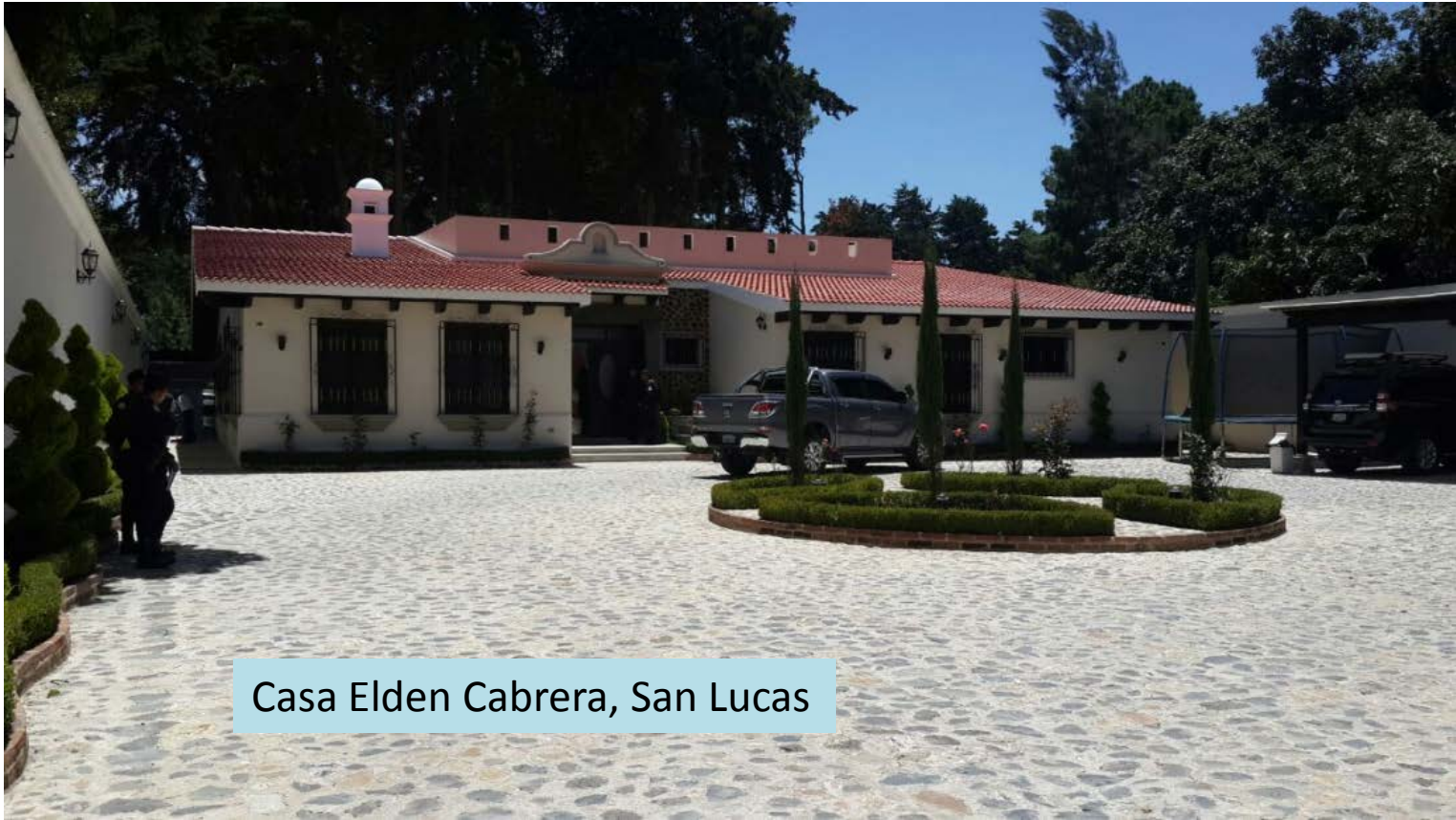
Casa Elden Cabrera, San Lucas