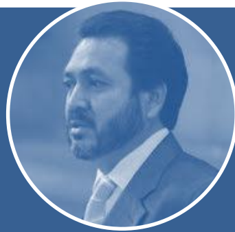
Caso Gudy Rivera