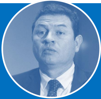
Caso Comisiones Paralelas